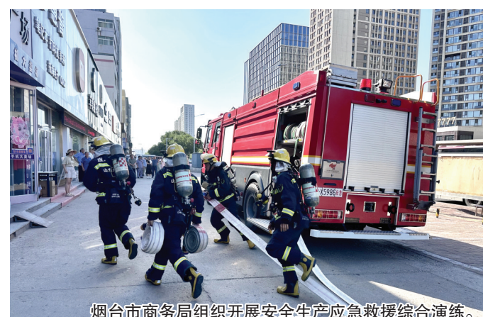
烟台市商务局组织开展安全生产应急救援综合演练。

置、信息上报、启动应急预案、人员疏散和消防救援等步骤,整个演练过程紧张有序进行,最终成功消除火情,保障了本市场及周边单位消防安全。通过演练,各部门参与人员进一步增强了消防安全意识,掌握了在火场中迅速逃生、自救、互救的基本技能,提高了抵御火灾和应对紧急突发事件的能力,同时也检验了三站市场联动救援协调机制的有效性。