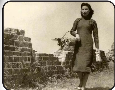
韦伟在《小城之春》中饰演周玉纹。(资料片)

据“北京国际电影节”公众号消息,中国电影史经典影片《小城之春》女主角的饰演者、老艺术家韦伟,于11月2日在香港去世,享年101岁。