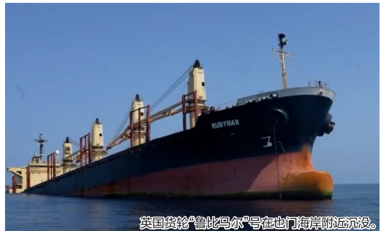
英国货轮“鲁比马尔”号在也门海岸附近沉没。