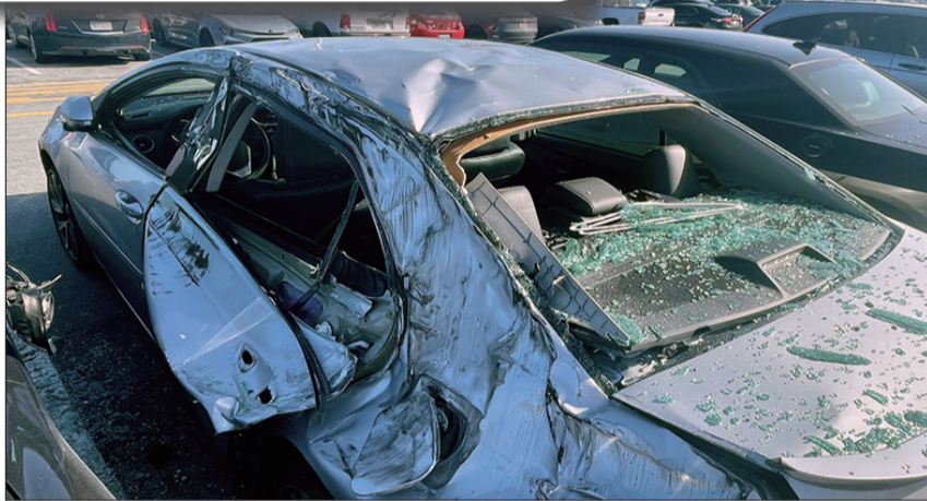
轮胎残骸砸坏的汽车。