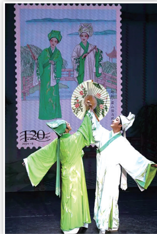
浙江小百花越剧院的青年演员在活动现场表演新版《梁山伯与祝英台》选段。

据新华社电 诞生于浙东古越大地上的越剧是我国最具代表性的剧种之一，中国邮政于20日推出《越剧》特种邮票1套3枚。