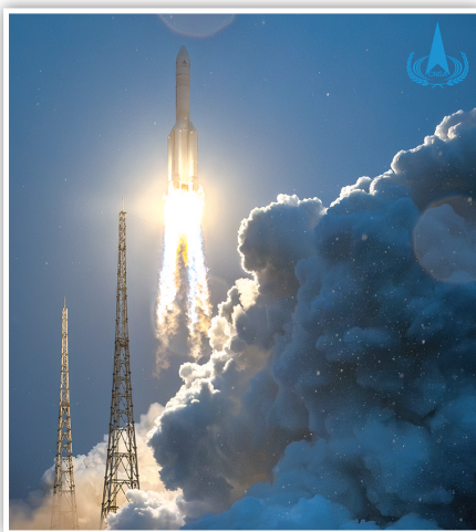
5月3日，嫦娥六号探测器由长征五号遥八运载火箭在中国文昌航天发射场成功发射。