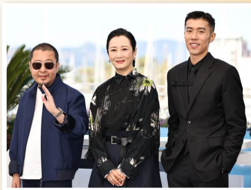
导演贾樟柯、演员赵涛、周游（从左到右）亮相影片《风流一代》拍照式。

贾樟柯说，“风流一代”这个词流行于上世纪70年代末80年代初，特指当时的青年，影片讲述了这充满能量的一代人如何一步步走向今天，又如何面对一切的变化。