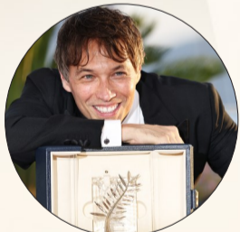
美国导演肖恩·贝克与“金棕榈奖”奖杯合影留念

本届戛纳电影节期间，多部中国影片在国际舞台上表现亮眼。其中，管虎新作《狗阵》获得“一种关注”单元最佳影片奖。贾樟柯酝酿20多年的新作《风流一代》、郑保瑞执导的《九龙城寨之围城》、陈可辛执导的《酱园弄》、经过4K修复的成龙主演经典电影《飞鹰计划》在电影节上放映时收获热烈掌声。此外，中外电影合作交流、电影《远去的牧歌》推介会等多场活动在中国馆内举办。