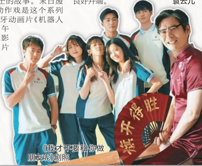
《我才不要和你做朋友呢》剧照