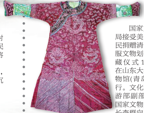
美国公民捐赠的清代袍服。

国家文物局接受美国公民捐赠清代袍服文物划拨入藏仪式19日在山东大学博物馆(青岛)举行。文化和旅游部副部长、国家文物局局长李群向山东省文物局颁发文物划拨入藏清册。