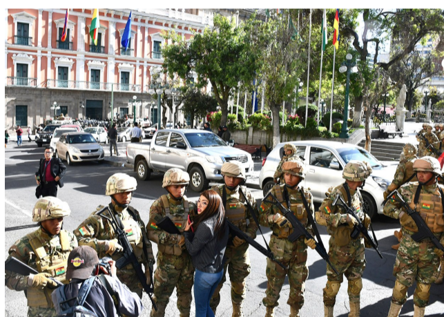
在玻利维亚拉巴斯,士兵聚集在总统府附近的街道上。