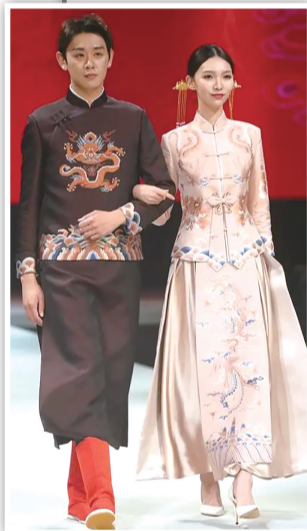
融合中国传统文化元素的宋锦中式婚庆礼服。