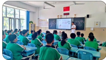
去学校举办讲座、进行义诊