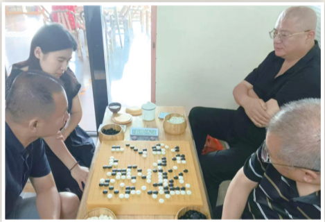
烟台棋手赛前训练

与往届不同的是，本届围棋赛首次全部采用双人联棋的形式。双人联棋是围棋赛的一种趣味形式，由四位棋手分成两组联手作战，轮流落子。由于同组两位棋手可能棋风迥异，或爱攻杀，或爱守地，因此棋盘上常常奇变陡生，变幻莫测，别有趣味。据悉，本次比赛共分为双人联棋公开组、双人联棋特邀组、双人联棋特邀名人组。