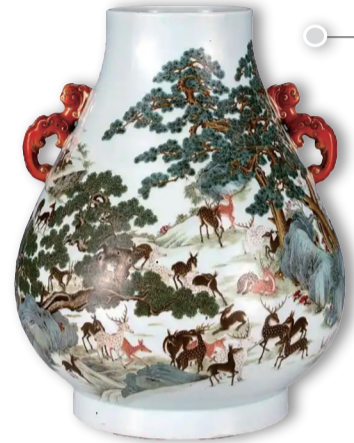
展览展出的“清乾隆款粉彩双凤耳百鹿尊”。

为迎接申遗成功后的首个春节，沈阳故宫博物院推出“家国同春——沈阳故宫节庆文化特展”，共展出近70件（套）馆藏文物珍品，通过辞旧迎新、祈福纳祥、团圆和美等主题，带观众领略清代宫廷年俗。