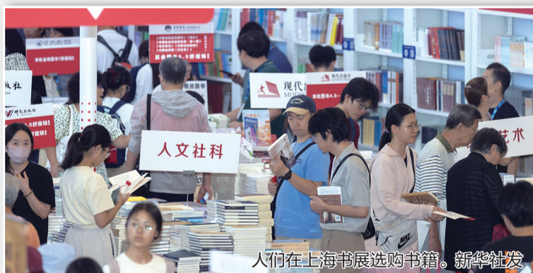
人们在上海书展选购书籍。

天府书展销售额超过1亿元，规模与影响力再创新高，前来参展的尼泊尔当代媒体与研究中心、当