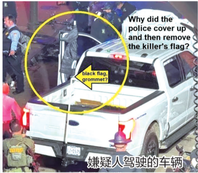
嫌疑人驾驶的车辆