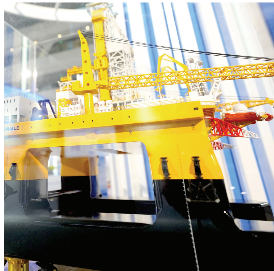
在绿色低碳高质量发展成果展展出的“蓝鲸1号”钻井平台模型和捷龙3号固体运载火箭模型。

展馆分为六大板块,重点围绕生态环保、科技创新、产业升级、改革开放以及民生保障等方面布展。展馆内数百件作品及模型展示了全省近几年深化新旧动能转换、绿色低碳高质量发展的成果、成效,其中不乏在全国甚至世界领先的科技