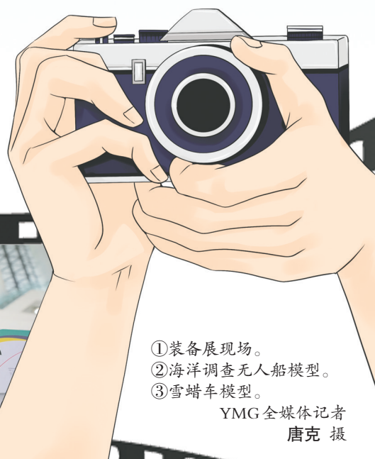
①装备展现场。 ②海洋调查无人船模型。 ③雪蜡车模型。