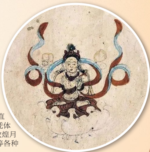
莫高窟第384窟-月光菩萨