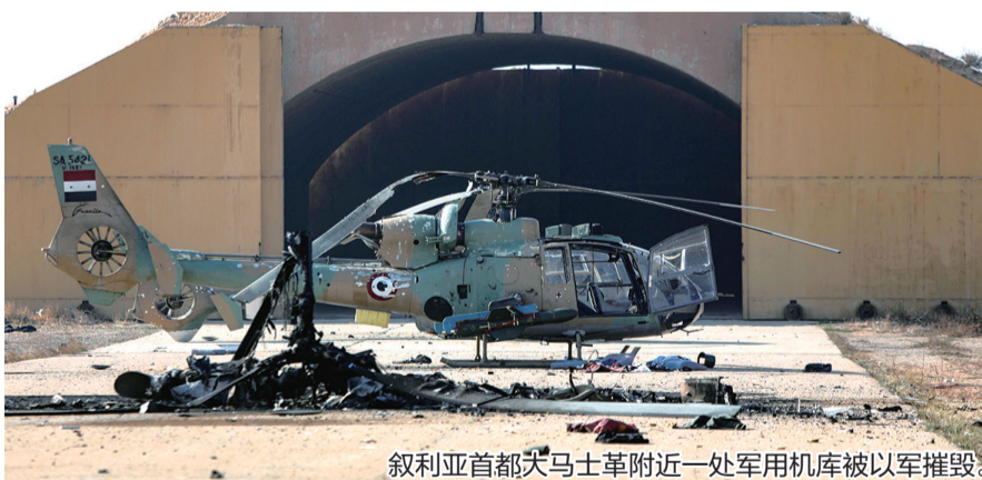
叙利亚首都大马士革附近一处军用机库被以军摧毁。

伊朗总统佩泽希齐扬8日晚间表示，应由叙利亚人民决定国家的未来，并呼吁叙社会各阶层展开对话以达成谅解。同