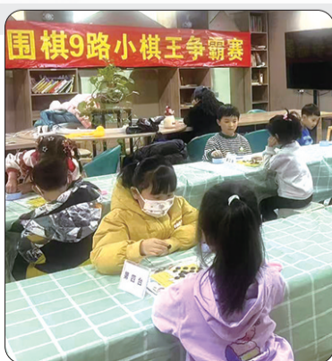
围棋9路小棋王争霸赛