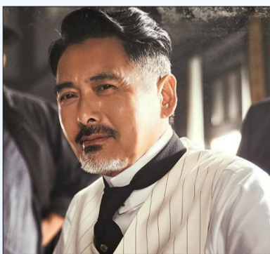
周润发在《唐探1900》中饰演白轩龄。

如果说“唐探”前三部靠讲述海外唐人街的故事在地理上获得了更为广阔的视野，那么《唐探1900》则借助1900年的时代背景，获得了更大的创作空间，让悬疑喜剧也拥有了历史厚重感。20世纪初，积贫积弱的清王朝大厦将倾，在海外，华人面临残酷压迫与歧视，美国《排华法案》带来巨大屈辱和伤害。正是在这样的背景下，晚清大臣、进步革命青年、出海劳工、唐人街大佬等纷纷登场，开始