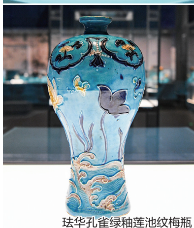
珐华孔雀绿釉莲池纹梅瓶

“这是我国首次对水下千米级深度古代沉船遗址开展系统、科学的考古调查、记录与研究。”国家文物局考古研究中心研究员宋建忠介绍，我国终于在南海叩开水下考古的“深蓝之门”。