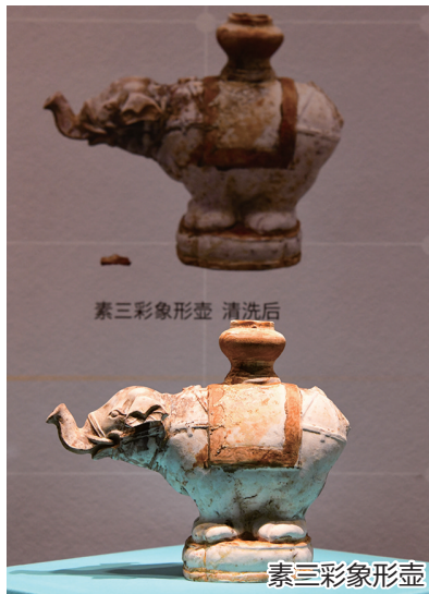
素三彩象形壶 清洗后

2023年至2024年，国家文物局考古研究中心、中国科学院深海科学与工程研究所、中国(海南)南海博物馆联合组队，对南海西北陆坡一、二号沉船遗址开展了三个阶段的深海考古调查，共提取出水文物900余件(套)，该遗址被列入2023年度全国十大考古新发现。