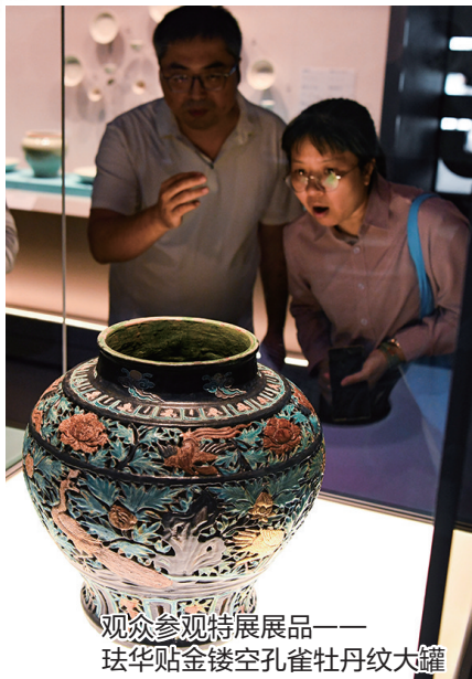
观众参观特展展品—— 珐华贴金镂空孔雀牡丹纹大罐