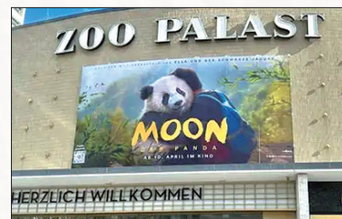
柏林动物园影院外挂起 《熊猫月亮》上映宣传海报

中国驻法兰克福旅游办事处6日在柏林动物园影院举办电影《熊猫月亮》点映活动。这是该中法合拍儿童电影在德国上映前举办的特别活动。