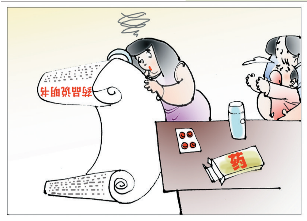
复杂的药品说明书